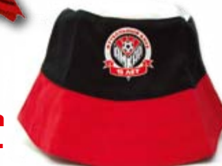
Панамка 200 руб.