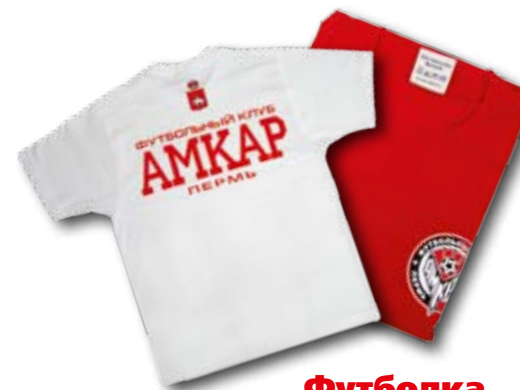
Футболка 350 руб.