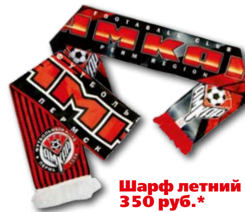
Шарф летний 350 руб.*