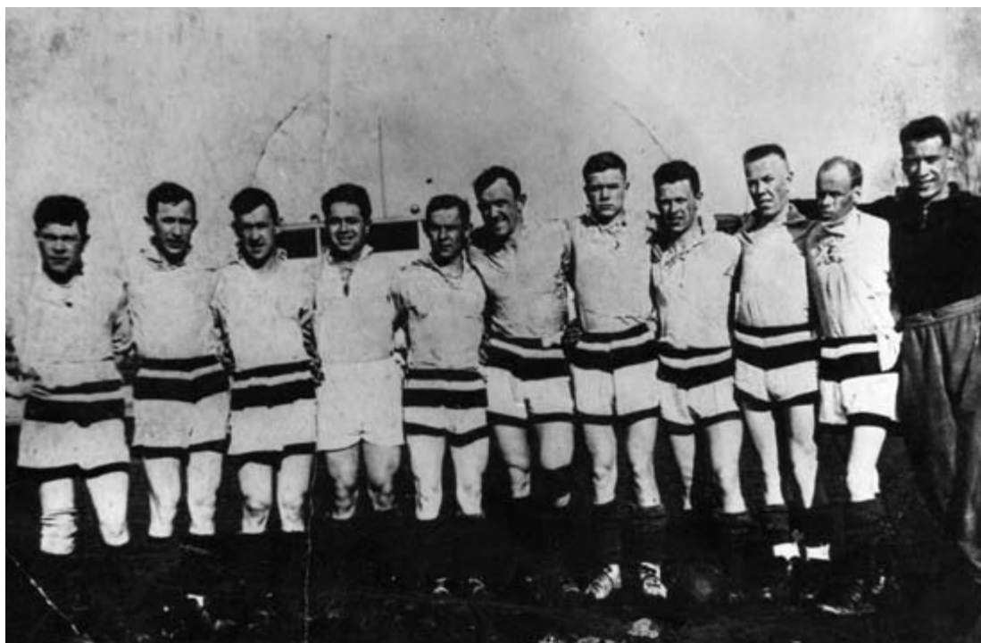
После игры «Динамо» – «Зид» - 2:1. Стадион «Динамо». 1934