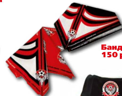
Бандана 150 руб.