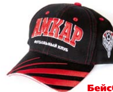
Бейсболка 500 руб.