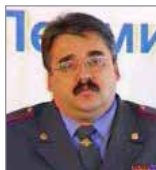
Милицию общественной безопасности г. Перми и лично полковнику Константину Строгому