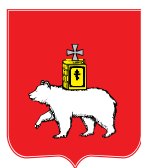
Депутатам Пермской городской думы