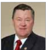
Депутатам Законода- тельного Собрания Пермского края и лично председателю Николаю Девяткину