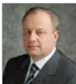
Главе города Перми Игору Николаевичу Шубину