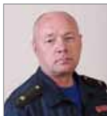
ГУ МЧС России по Пермскому краю и лично генералу-майору Олегу Попову