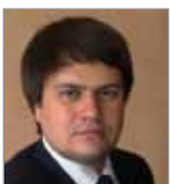
Руководителю агентства по спорту и физкультуре администрации Пермского края Руслану Садченко