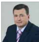
Председателю Прави- тельства Пермского края Валерию Сухих