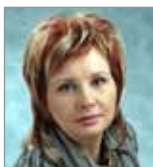
Заместителю главы г. Перми Надежде Кочуровой