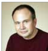
Губернатору Пермского края Олегу Чиркунову