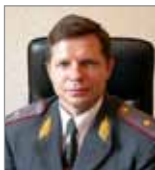
ГУВД по Пермскому краю и лично генералу- лейтенанту милиции Юрию Горлову