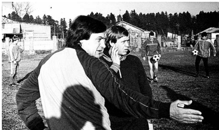
«Звезда» на сборах в Грузии, 1986 год

1985 год. Пермская «Звезда» за тур до окончания чемпионата становится победителем второй зоны РСФСР второй лиги. Отрыв от ближайшего преследователя, свердловского «Уралмаша», составил пять очков.